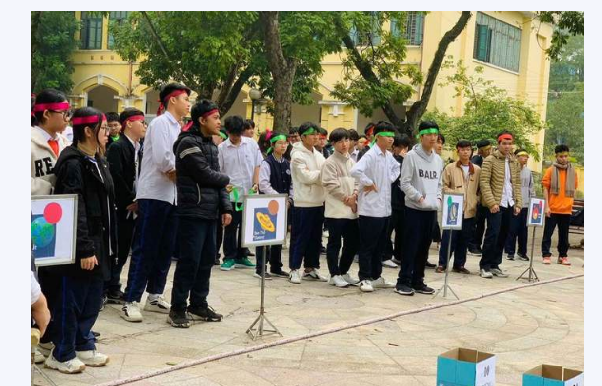
NGÀY HỘI VẬT LÝ THIÊN VĂN