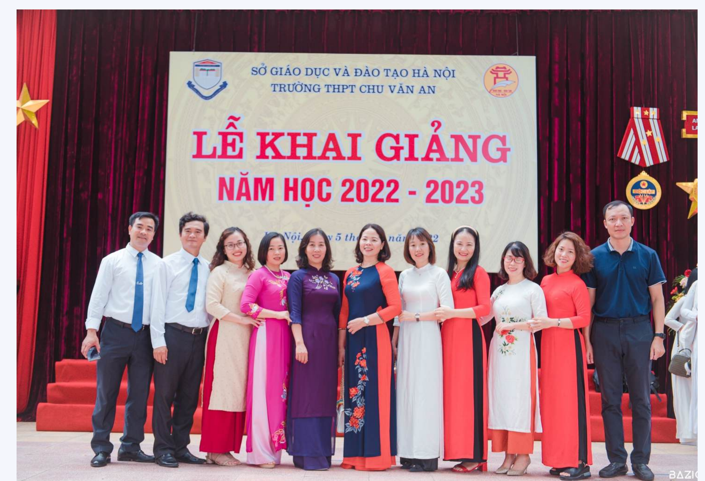
GIÁO VIÊN VẬT LÝ

Ngoài các câu lạc bộ sở thích trong trường, học sinh Chuyên Lý còn được tham gia các hoạt động chuyên đề do bộ môn Vật Lý, tổ KHTN tổ chức