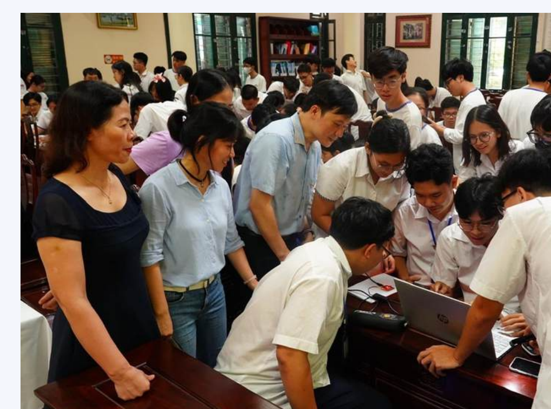
Nghiên cứu khoa học